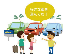
イメージ / アラモセレクト

同じ車種ならあっちの車の方がいいなあ。赤い車に乗りたいなあ!と思ったことはありませんか? アラモレンタカーなら駐車場に並んだ豊富な種類から、ご契約内容にあったお好みの車をお選びいただけます。旅のドライブをお気に入りの車で楽しく快適に!! 注) ホノルル空港営業所でのサービスとなり、ワイキキ市内営業所では行っておりません。