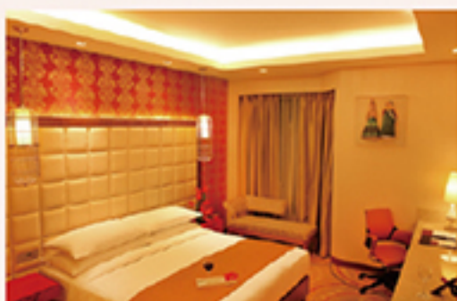
〈一例〉メトロポリタンニューデリー客室