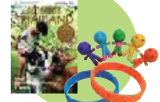
AMAZING THAILAND THANKS TOUR

そんな思いで、このような企画を考えて来ました。私達エステーワールドスタッフは、これからもたくさんの分野でこのような「旅十少気づき、そして感動ツアー」を増やし続けたいと考えています