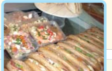
サンドイッチ・デリ

フランスパンにハムやチーズが挟まってボリュームたっぷり。ひとりのデリは新鮮でボリューム満点。帰って食事の際に飽きたときにお勧めです。