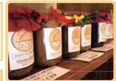
ショコラ モランチョコ