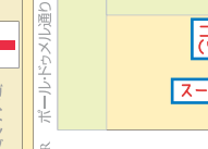
コンテストブリー (ウィンジョアグラ)